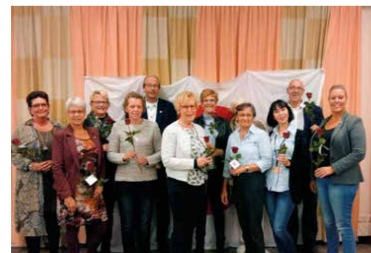
Spelduitreiking 3 november Sint Jansdal Ziekenhuis