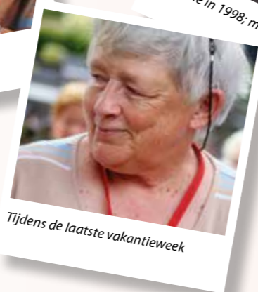
Tijdens de laatste vakantie week